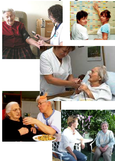
Image der Altenpflege